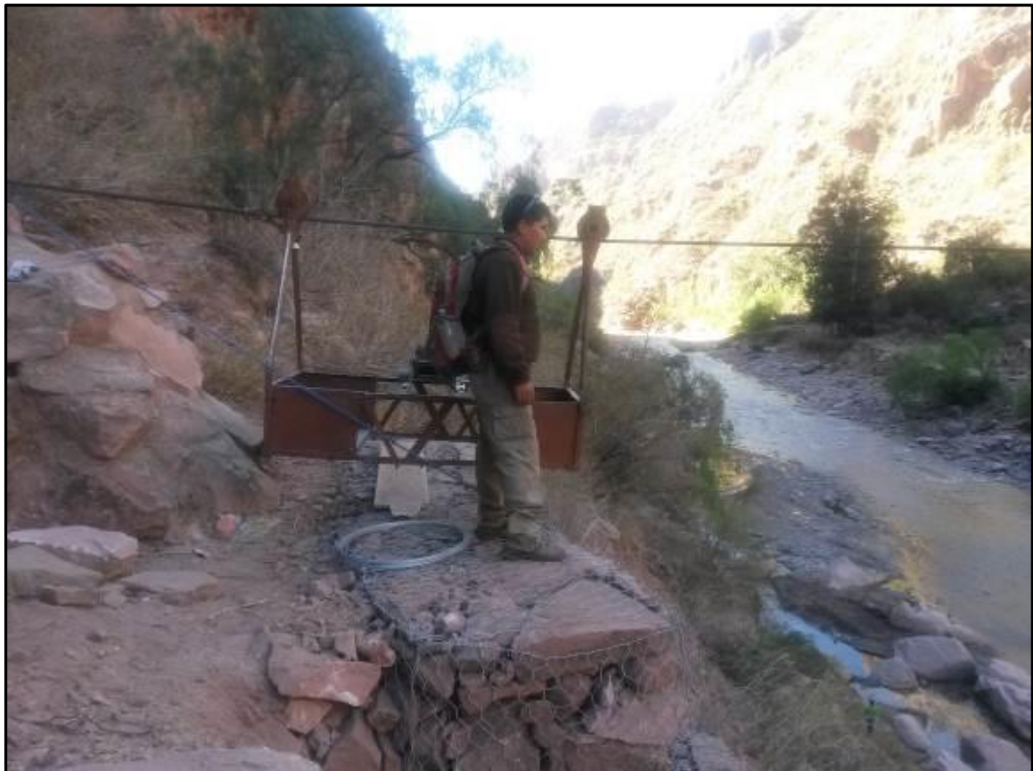
Fotografía N° 2: estado de la barranca y la base del carro de aforo, año 2016