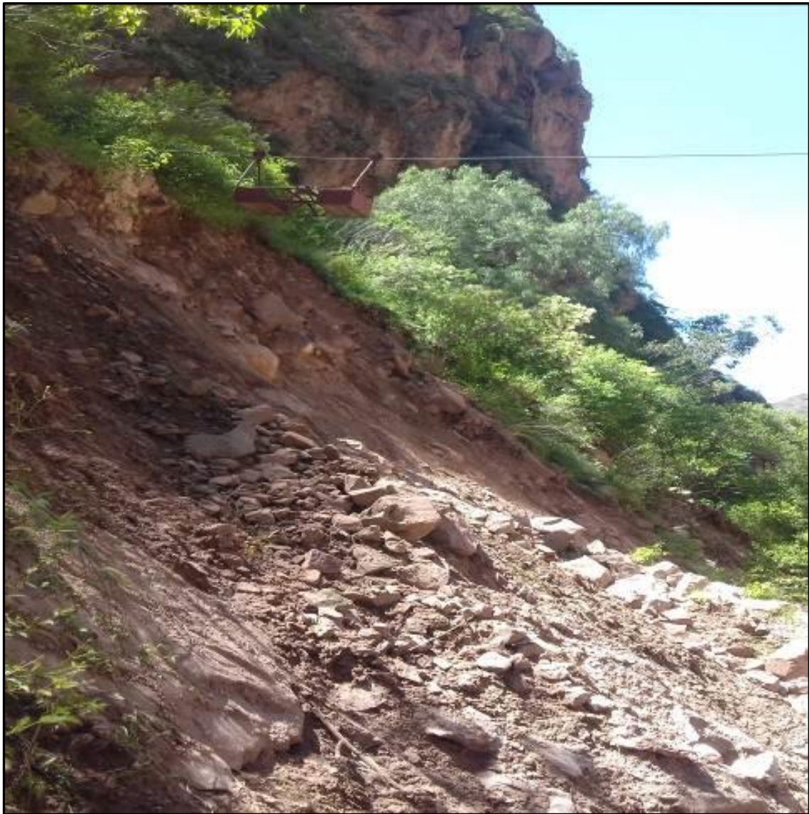
Fotografías N°3: estado de la barranca y base del carro de aforo, año 2018