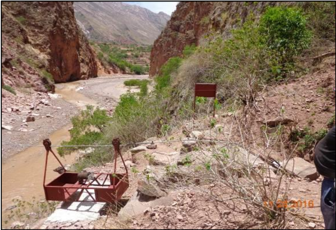
Fotografía N° 1: estado de la base del carro de aforo y de la barranca, año 2016