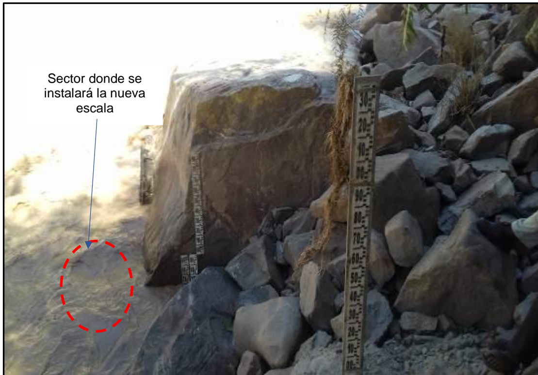
Fotografía N° 4: sección de escalas arriba de la sección de aforo, año 2018